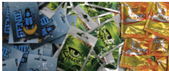
^ NpS in Form von Kräutermischungen

Bunte Verpackungen und kreative Bezeichnungen sollen einen harmlosen Eindruck der NpS vermitteln. Das Gesundheitsrisiko ist damit jedoch unkalkulierbar. Auf den Verpackungen werden Inhaltsstoffe meistens nicht oder falsch angegeben. Neben NpS sind darin auch andere Betäubungsmittel enthalten. Zudem werden die Inhaltsstoffe eines Produkts im Laufe der Zeit immer wieder verändert, so dass bei wiederholtem Konsum einer bestimmten Mischung nicht mit der gleichen Wirkung zu rechnen ist.