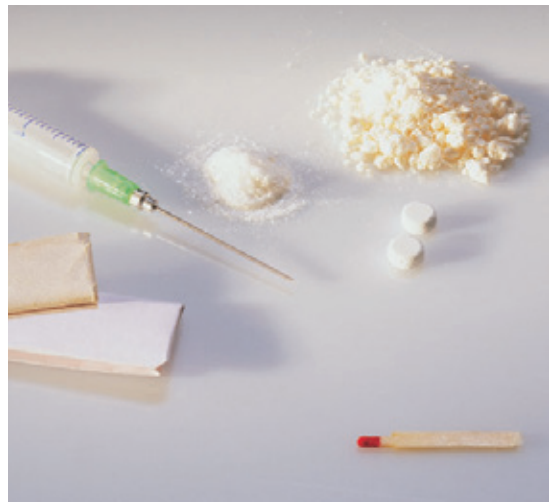
^ Amphetamin als weißes Pulver und in Tablettenform