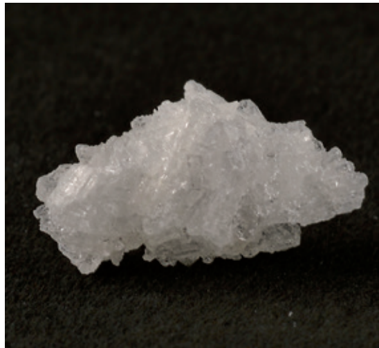
^ Kristallines Methamphetamin („Crystal Meth“) in typischer Erscheinungsform